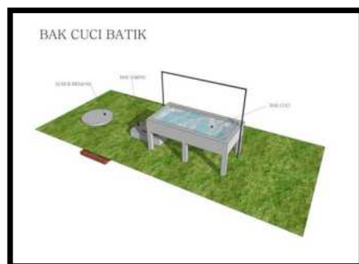
Tempat pelorotan (bak cuci batik)