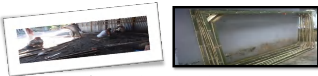
Gambar 7 Penjemuran Bidang-bidang dari Bambu