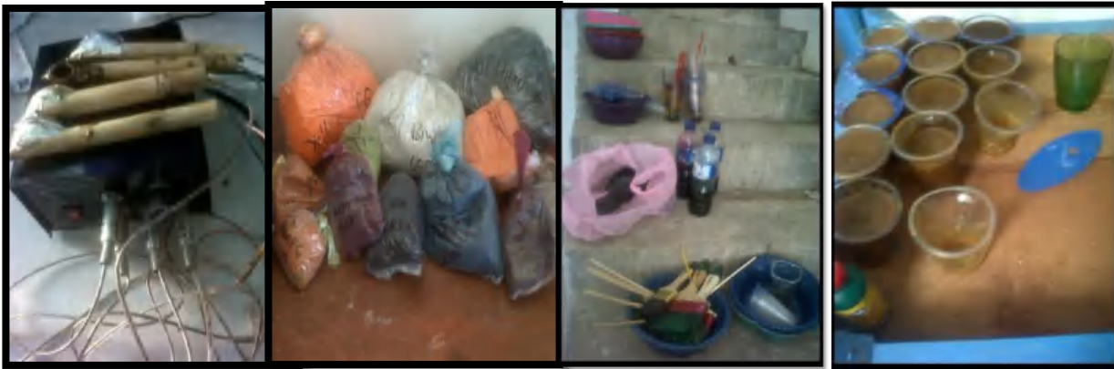
Gambar 5 Bahan-bahan untuk membatik