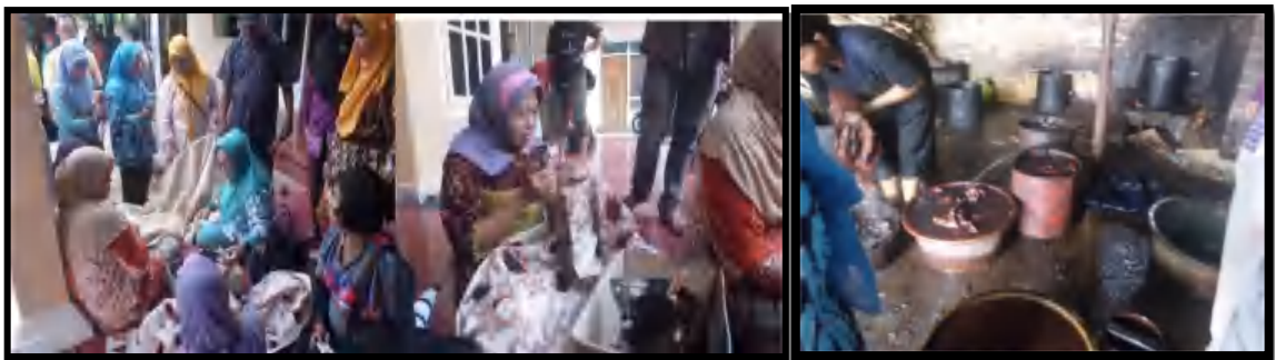
Gambar 1 Desain maotif batik masih sederhana dan Tempat pembuangan limbah pelorodan dibuang pada halaman