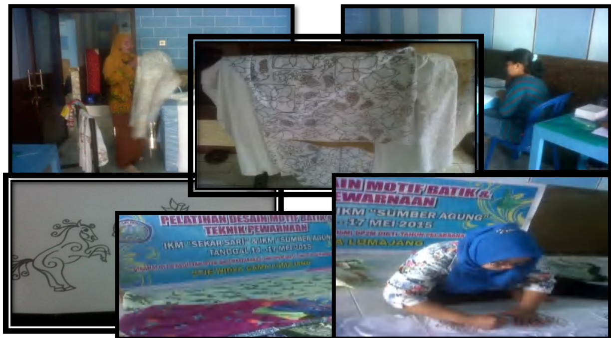
Gambar 4 Pelatihan awal dan mendesain motif dengan gambar kuda menari, pisang dan nangka