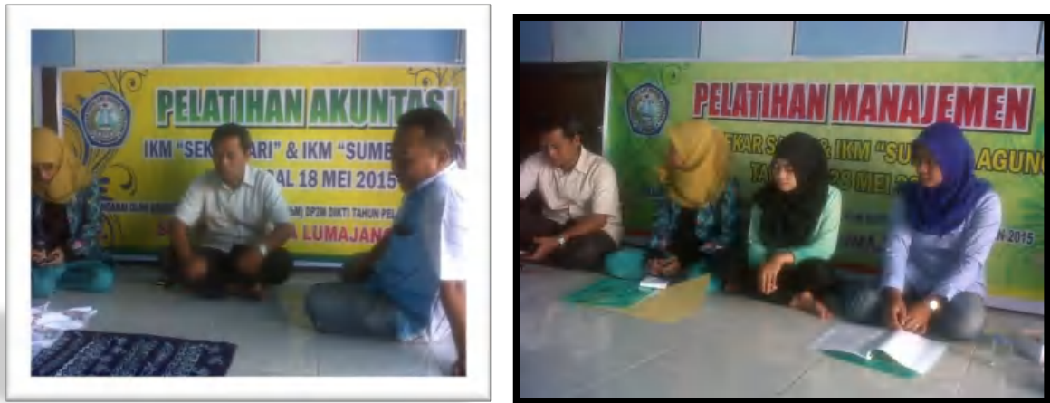
Gambar 9. Pelatihan Akuntansi dan Pemasaran Sederhana