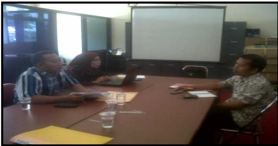
Gambar 2 Diskusi Tim