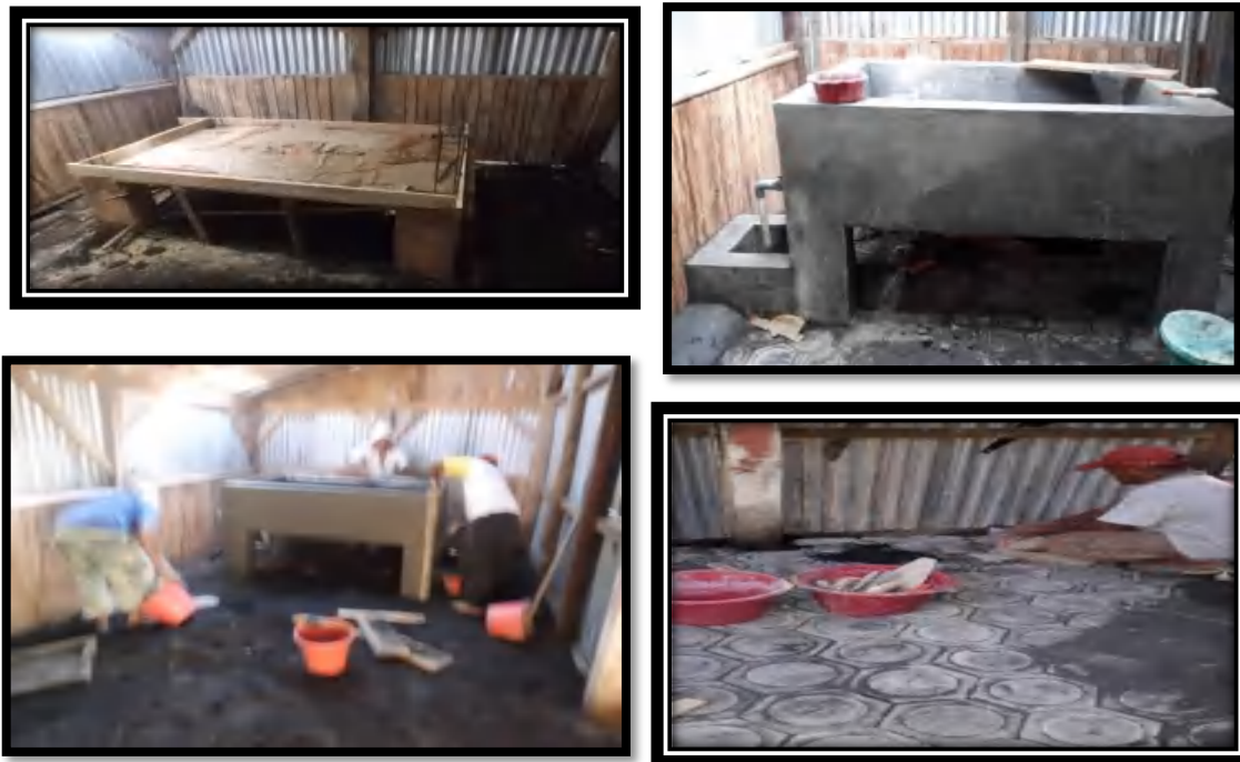
Gambar 8. Pembuatan pelorodan dan pembuangan limbah