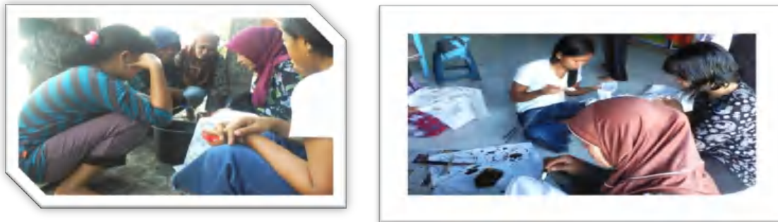
Gambar 6 Proses pencantingan/pencolotan, pewarnaan dasar, sampai dengan penjemuran