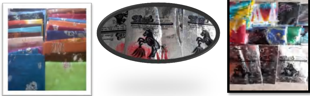
Gambar 10. Produk batik yang berciri khusus dan estetikan tas Untuk Memperkenalkan Nama Batik “Pirana”