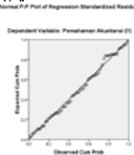
Gambar 4.1 Pengujian Normalitas data

Pengujian normalitas dilakukan terhadap residual regresi. Pengujian dilakukan dengan menggunakan grafik probability plot. Data yang normal adalah data yang membentuk titik yang menyebar tidak jauh dari garis diagonal. Hasil analisis regresi linier dengan grafik normal probability plot terhadap residual error model regresi diperoleh sudah menunjukkan adanya pola grafik yang normal, yaitu adanya sebaran titik yang berada tidak jauh dari garis diagonal.